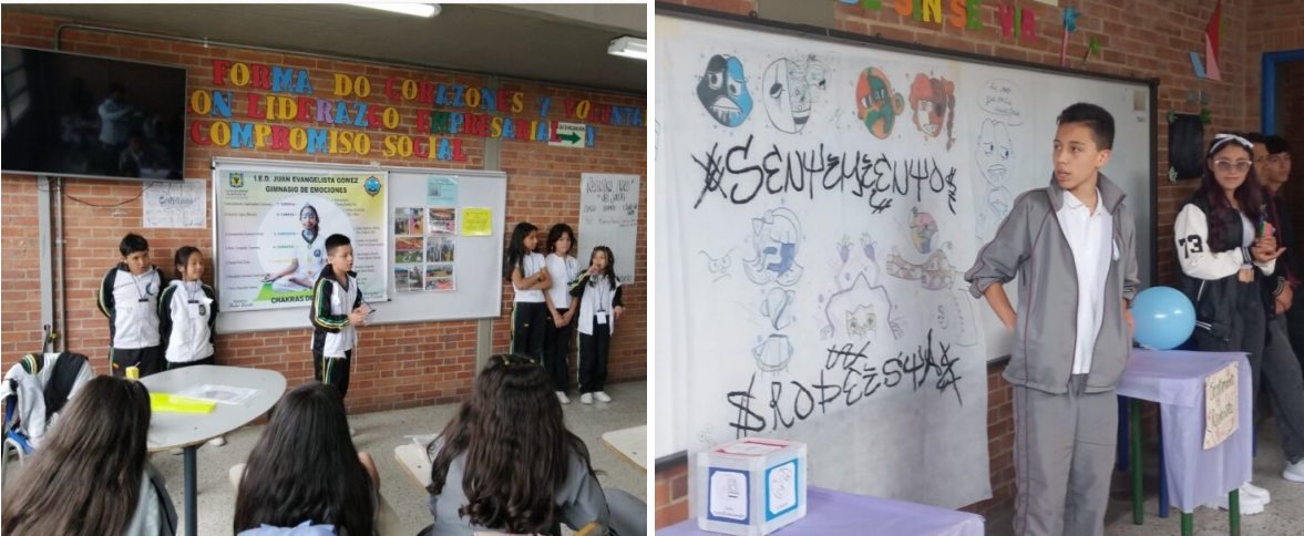
Fotografía 23 y 24. Encuentro local de súper ideas lideradas por niñas y niños en San Cristóbal "Los súper tesos a la vista"