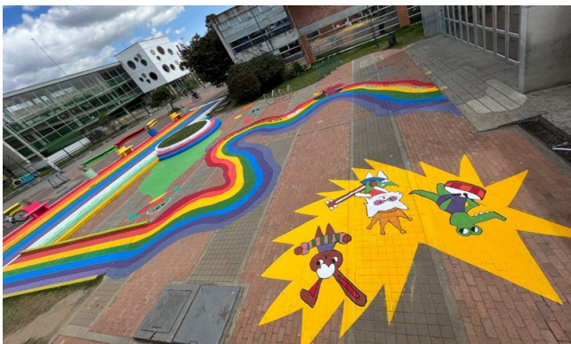
Fotografía 27, 28 y 29. Calle mágica, intervención Colegio Gimnasio del Campo Juan de la Cruz Varela (IED) -Sede Erasmo Valencia vigencia 2023.