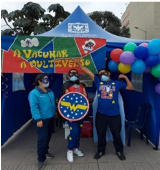
Fotografía 11. A vacunar el Multiverso. Conmemoración día del niño 20 abril.