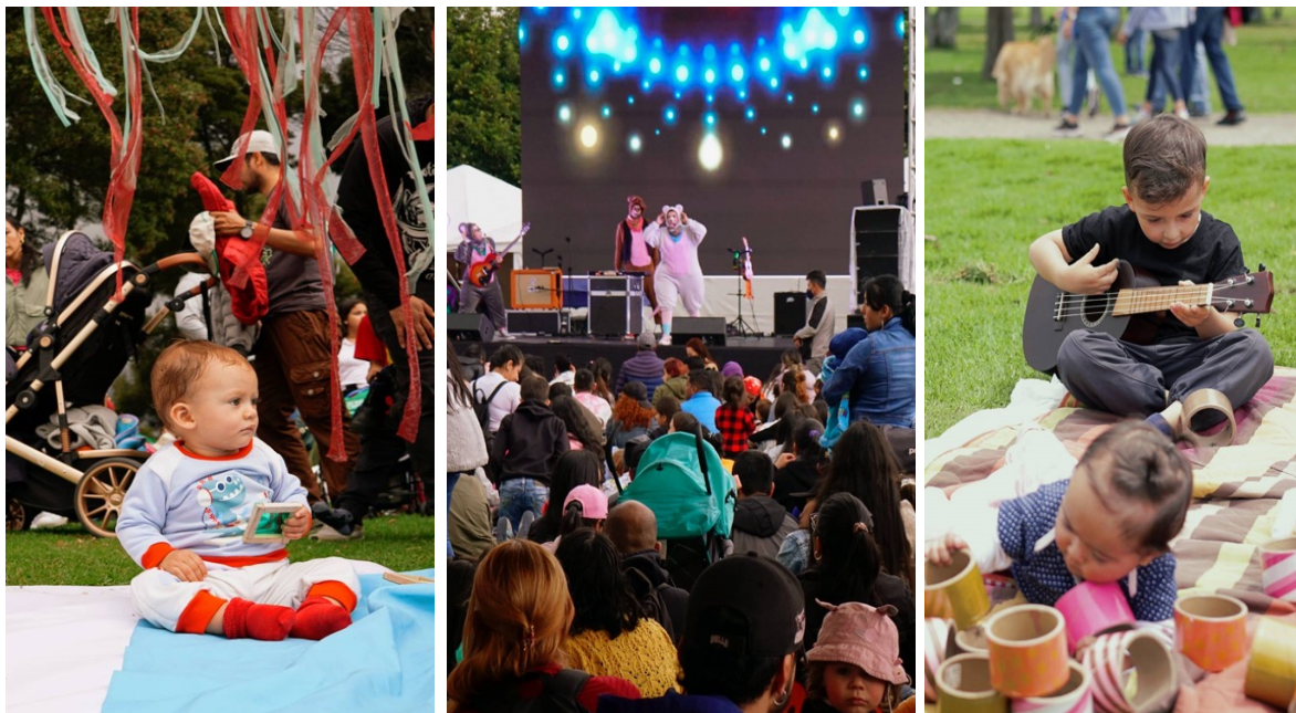
Bebés al parque 2023.