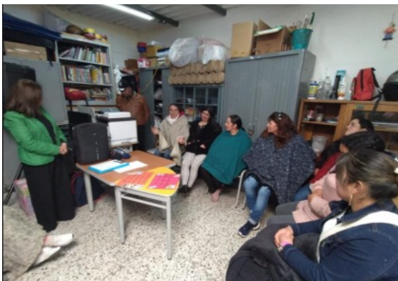
Fotografía 36. Taller de familias-Escuela Rural la Mayoría.

con el fin que se puedan implementar y apropiar en cada uno de los entornos familiares. Así las cosas, las escuelas realizadas tuvieron gran acogida y disposición por cada uno de los asistentes comprendiendo su importancia y apropiando los conocimientos adquiridos para fortalecer relaciones armoniosas entre niñas, niños y adultos.