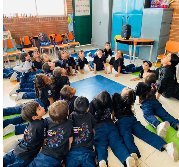
Fotografía 5. Mi cuerpo, mi territorio. Taller de teatro en alianza con la Alcaldía Local de Kennedy.