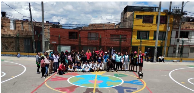
Calle Mágica, parque vecinal Villa Hermosa, Kr 6B Este, Cl 97B Sur