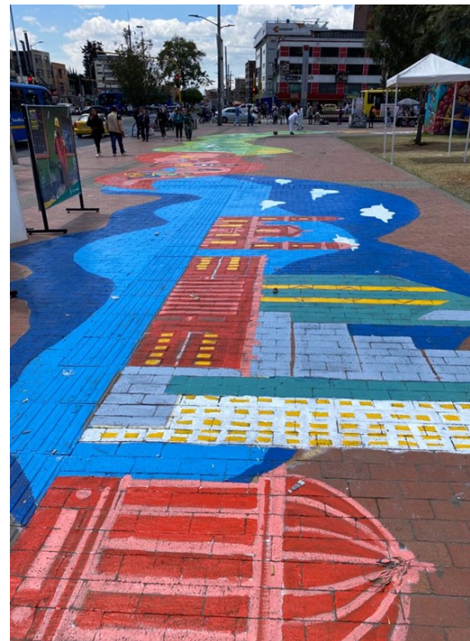
Calle Mágica, estación intermedia Av. Primera de Mayo,