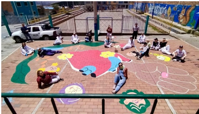
Calle Mágica, colegio Comercial Madre Eliza Roncallo,