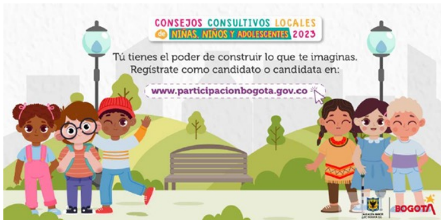
Fotografía 9. Pieza publicitaria para participar en el proceso eleccionario de los CCLONNA (2023-2025).