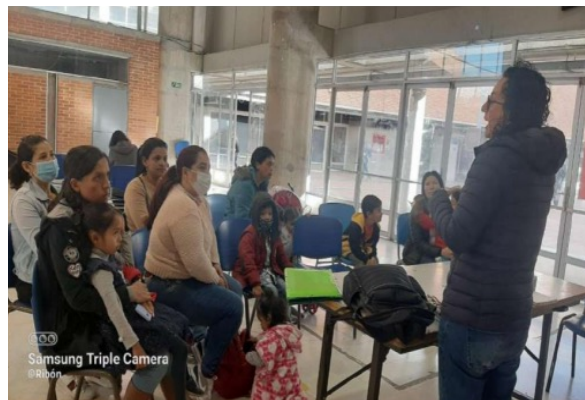
Fotografía 37. Taller de Familias-Colegio Nicolás Buenaventura.