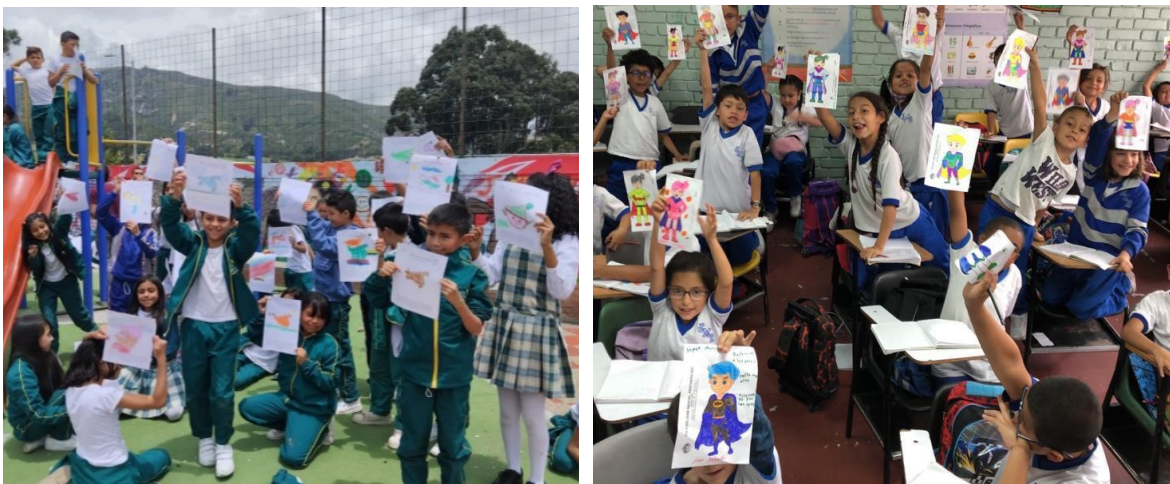
Fotografía 16 Y 17. Celebración día de las niñas y los niños 20 de abril.