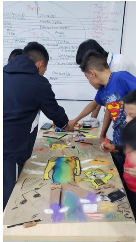
Fotografía 22 Y 23. Actividades del día de los niños y las niñas Crea Manitas, Colegio Fanny Mikey, línea Arte en la Escuela.