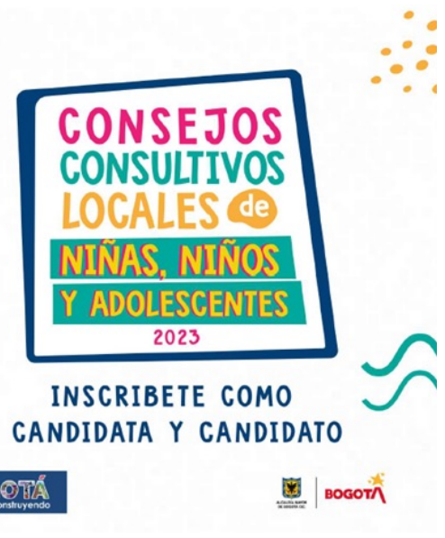
Fotografía 8. Pieza publicitaria para participar en el proceso eleccionario de los CCLONNA (2023-2025).