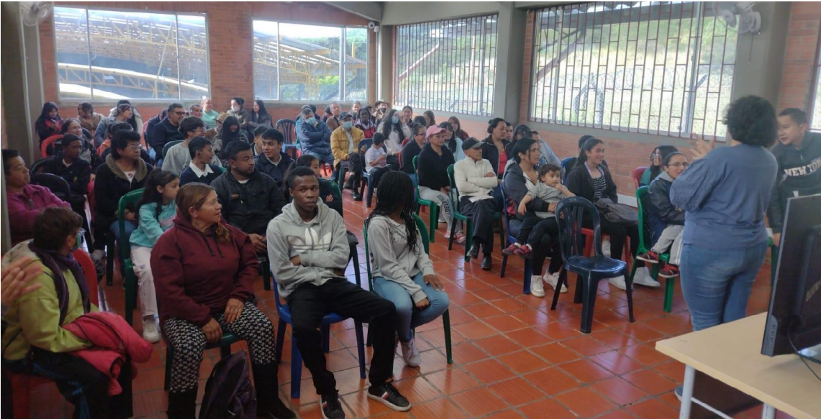
Fotografía 30. Asamblea con niños niñas y adolescentes participantes del Programa Crea- Crea Entre nubes (2023).