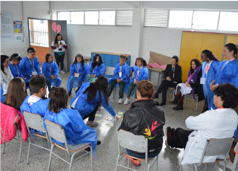
Fotografía 35. laboratorio creativo-Localidad Ciudad Bolívar- eje del medio ambiente y todas las formas de vida