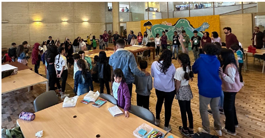
Fotografía 10. Primera sesión de la Mesa de Participación Cultural de Niñas, Niños y Adolescentes.