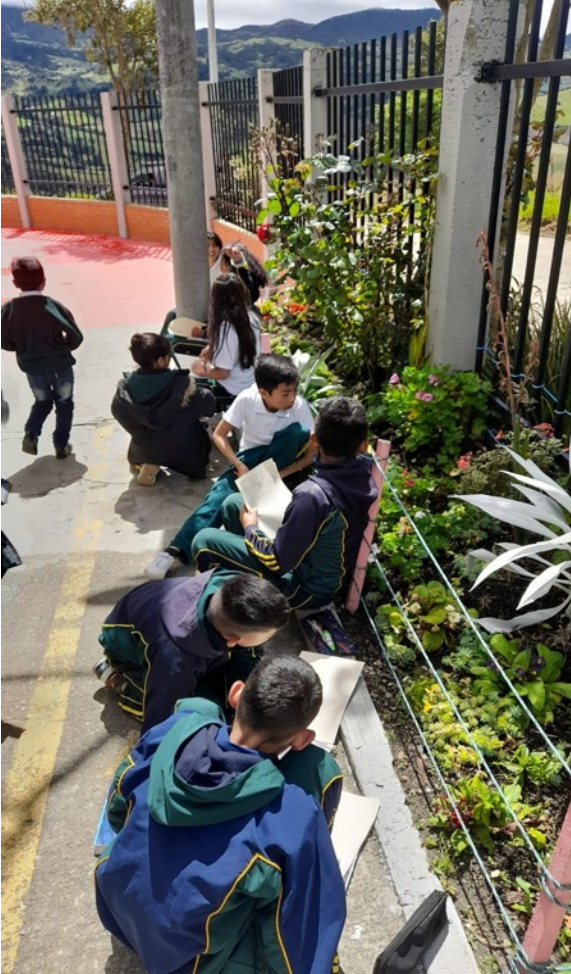
Fotografía 4. Colegio Olarte. Creación de dibujos y fotografías para la diagramación de una cartilla sobre plantas del territorio. Empoderamiento de los medios de comunicación.