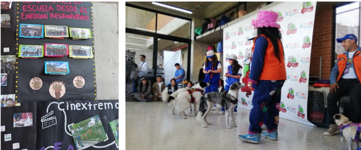
Fotografía 25 y 26. Encuentro Distrital Red de Escuelas como territorios de Paz.