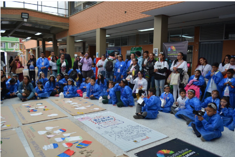
Fotografía 34. Laboratorio creativo-Localidad Ciudad Bolívar.