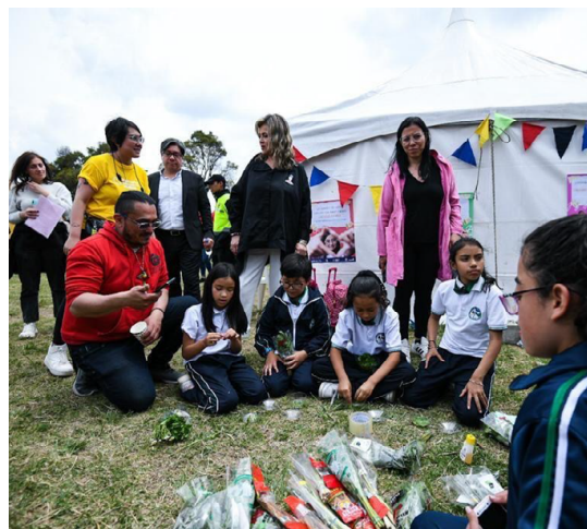
Fotografía 13 Y 14. Conmemoración, Día de la Ciudad de las Niñas, Niños y Adolescentes, 20 de abril.