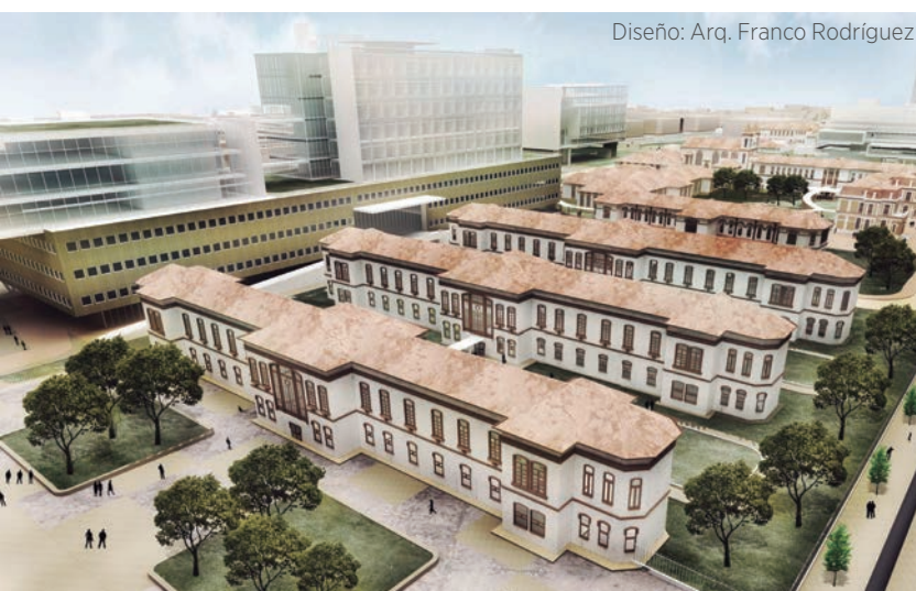
Diseño: Arq. Franco Rodríguez

Ubicación: Conectado hacia el centro por las calles 13 y 26 y por la avenida La Esperanza, y hacia el norte, por las avenidas Boyacá y Ciudad de Cali.