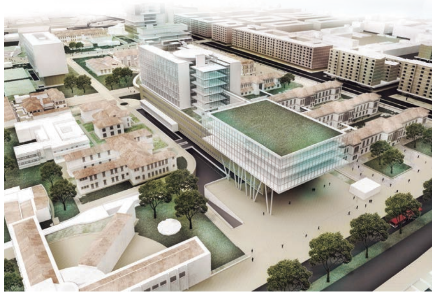
Diseño: Arq. Franco Rodríguez