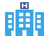
Hospital Santa Clara (23)