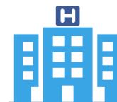
Materno Infantil (10)