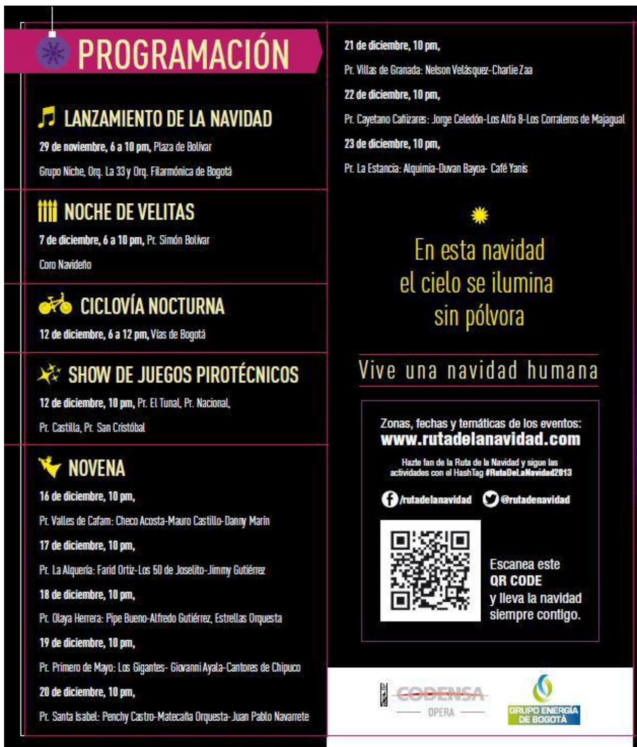
Gráfica 2. PROGRAMACION DE EVENTOS PARA LA TEMPORADA FIN DE AÑO 2013 – 2014.