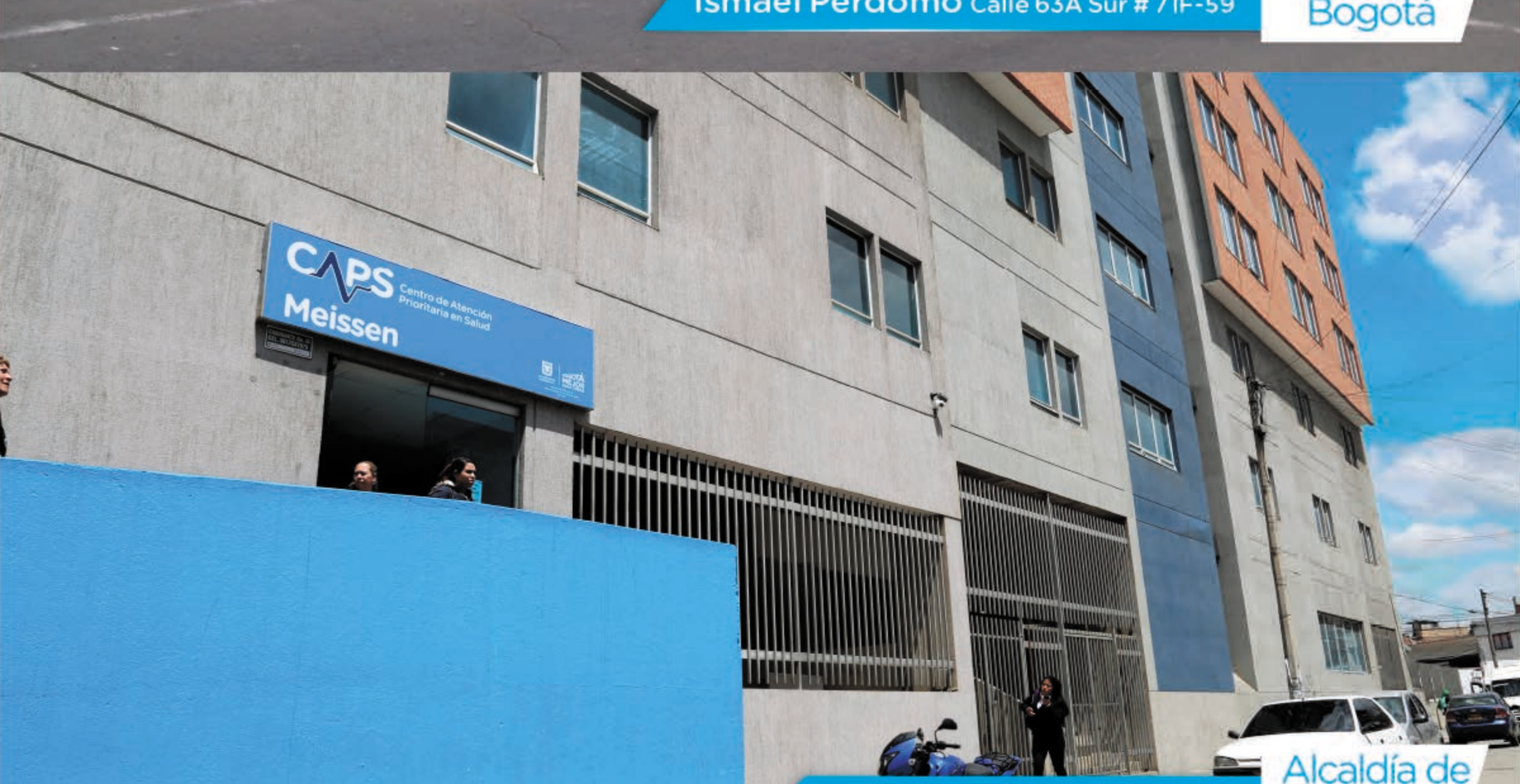
Meissen Calle 60G Sur # 18A-33