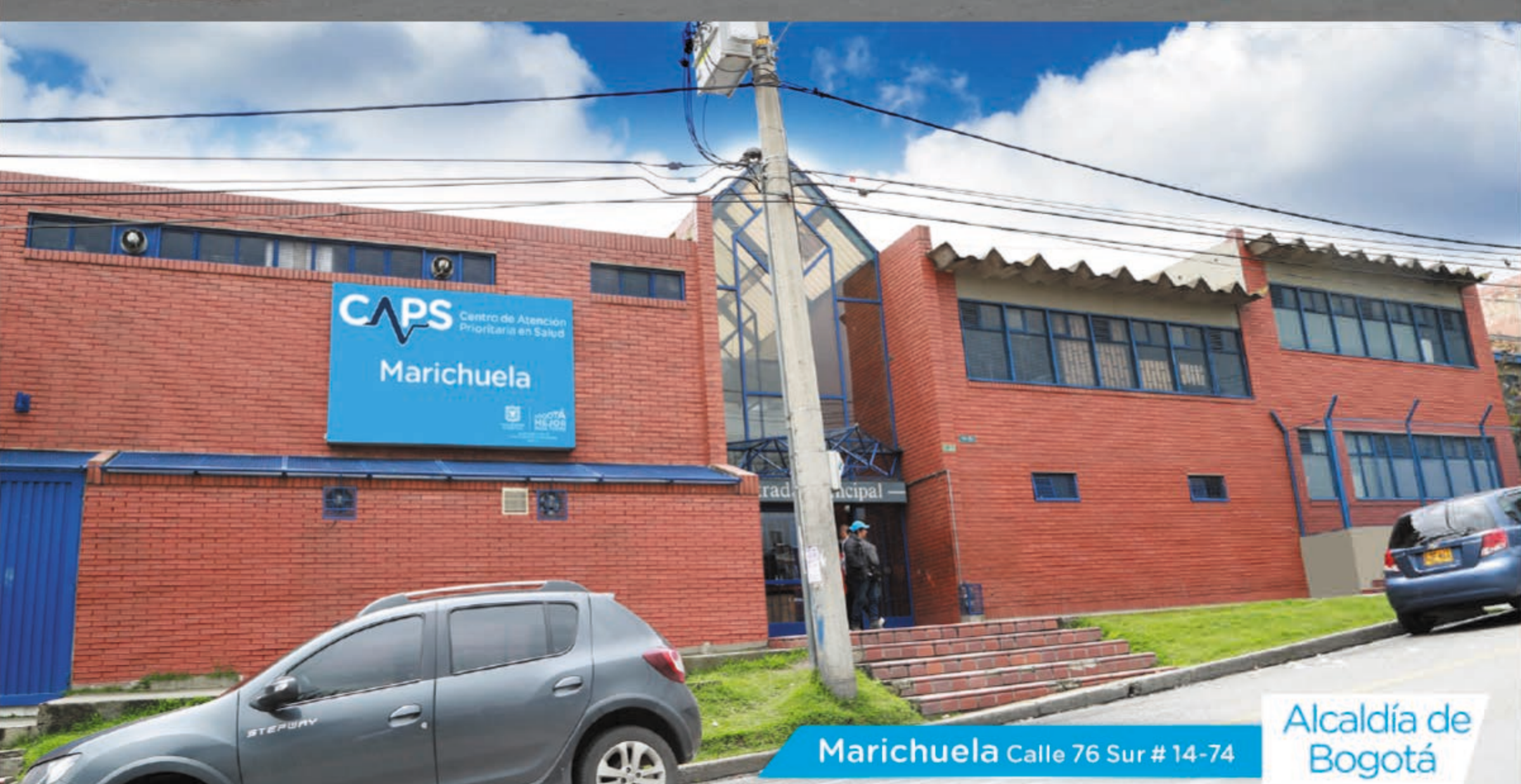
Marichuela Calle 76 Sur # 14-74