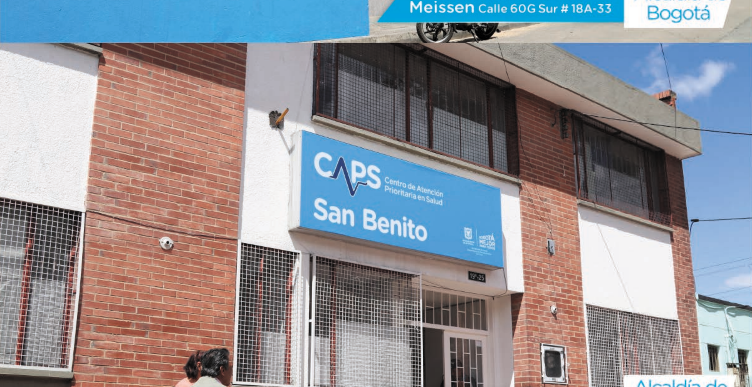
San Benito Calle 58 Sur # 19B-25