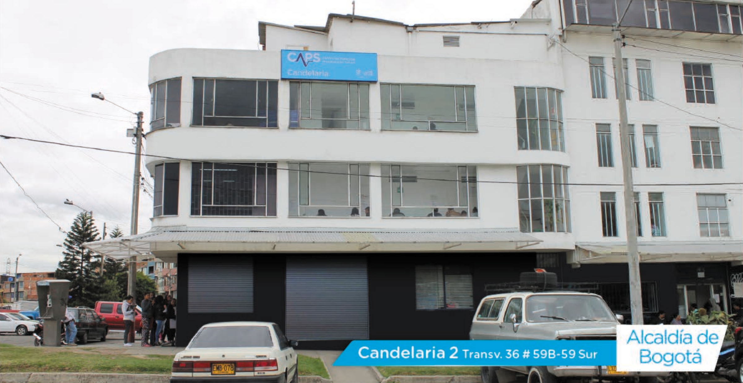
Candelaria 2 Transv. 36 # 59B-59 Sur