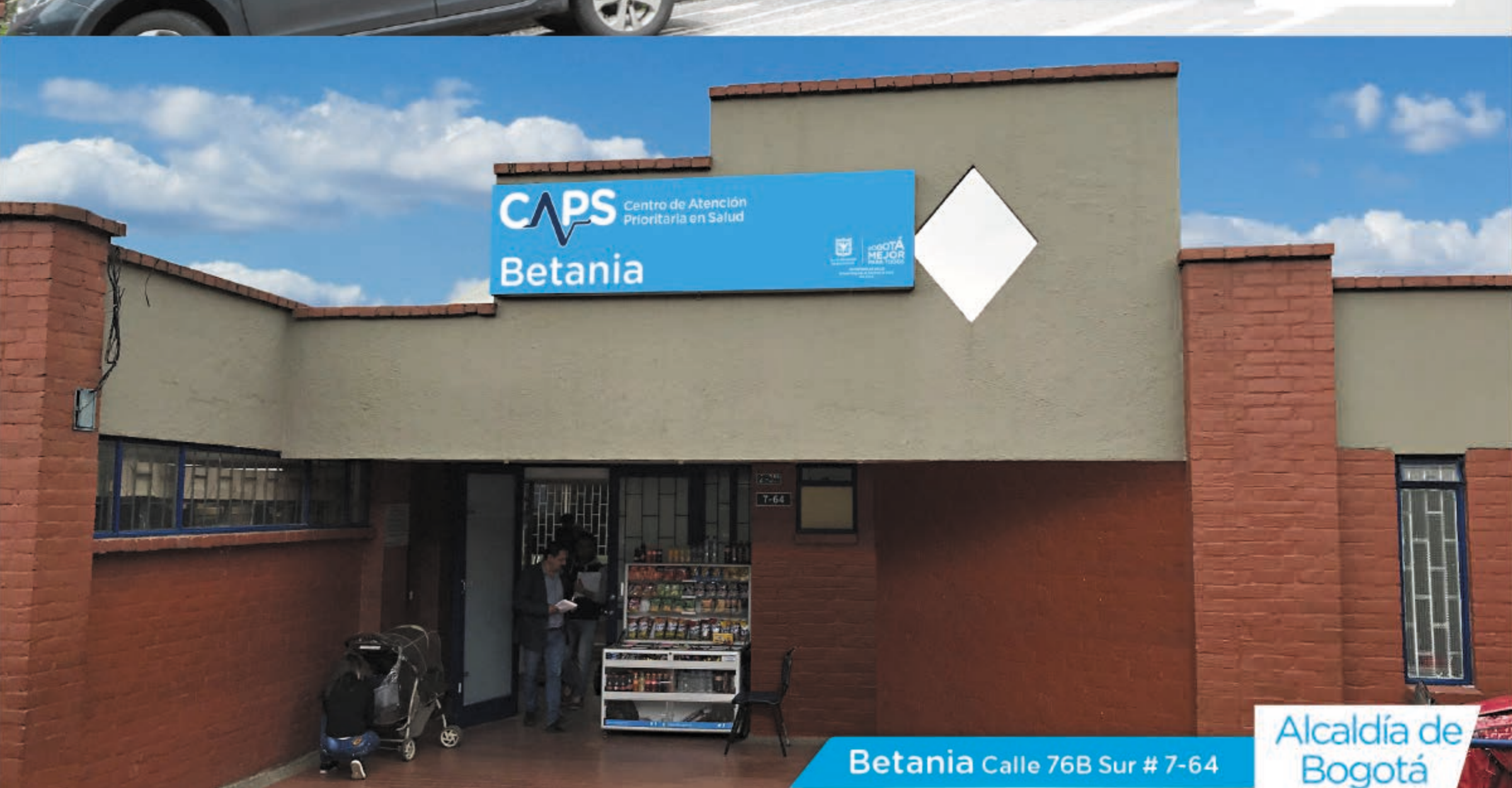
Betania Calle 76B Sur # 7-64