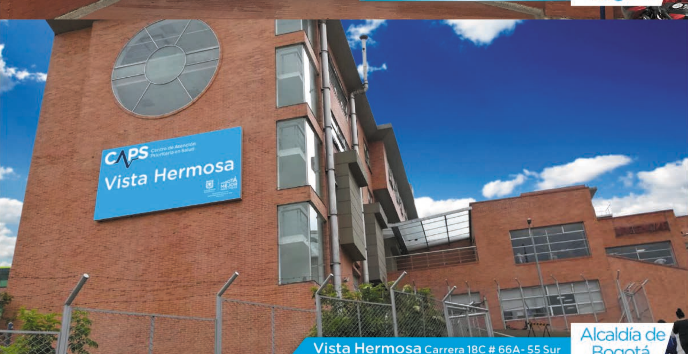
Vista Hermosa Carrera 18C # 66A- 55 Sur