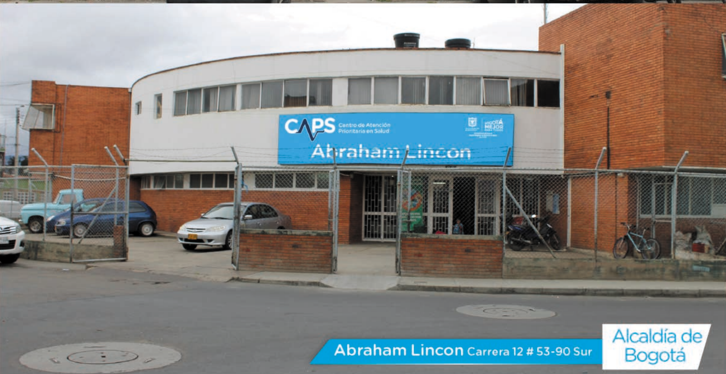
Abraham Lincon Carrera 12 # 53-90 Sur